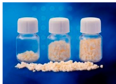
Granules d'os spongieux