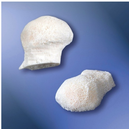
Tête fémorale complète et ½ tête