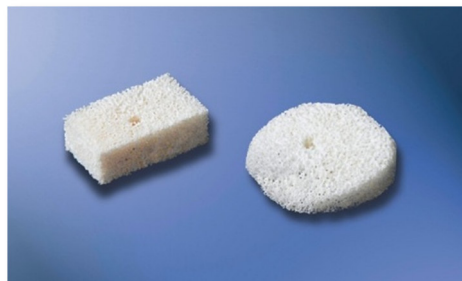
Bloc spongieux et coin osseux