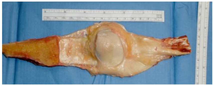
Exemple de tendons et ligaments : appareil extenseur complet de genou