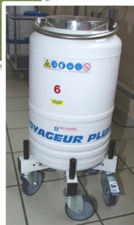
« VOYAGEUR » de transport